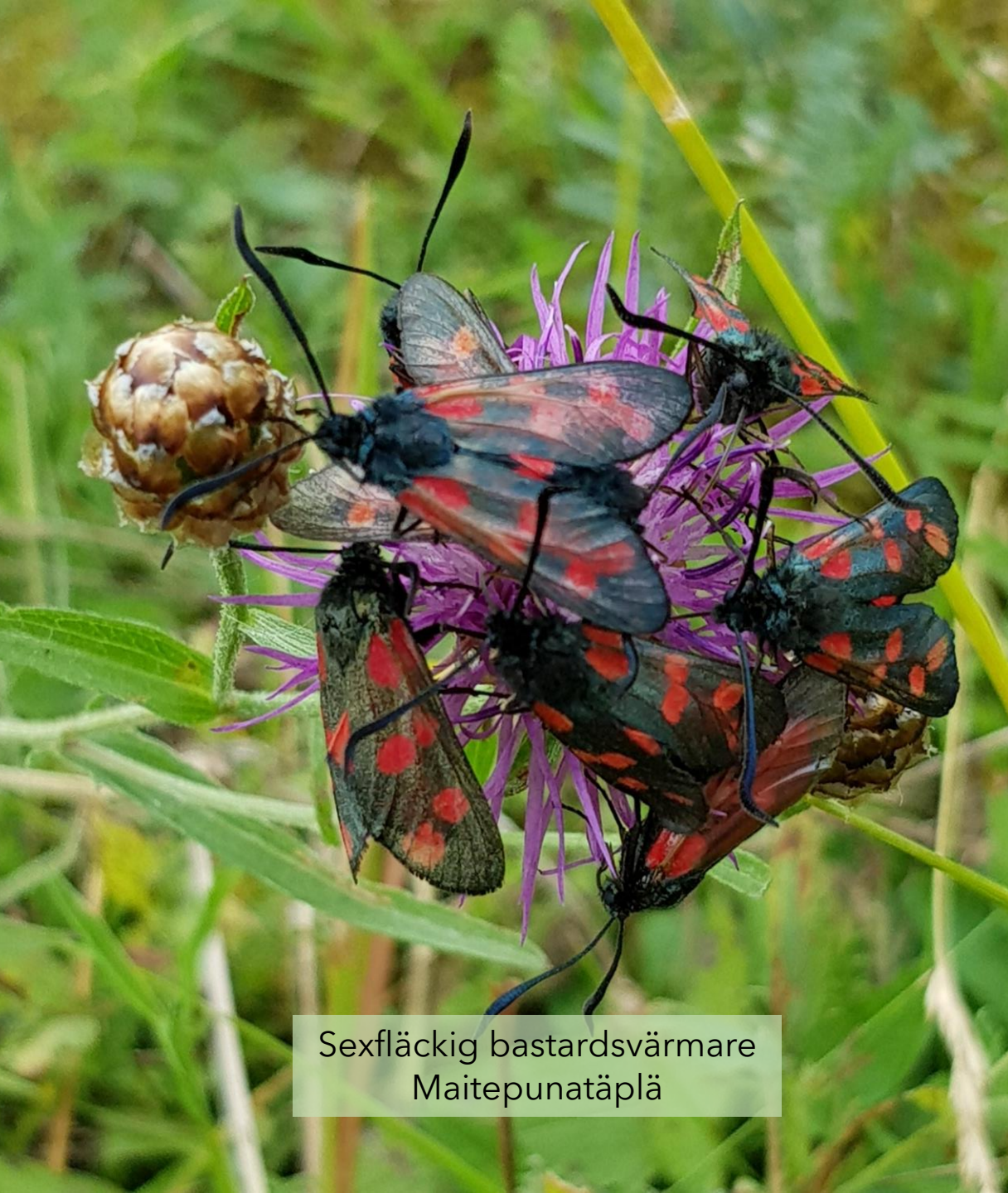
Sexfläckig bastardsvärmare Maitepunatäplä